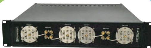
Ducommun供应开关矩阵解决方案!

www.ducommun.com/engineeredolutions/rfproducts 欲获取更多信息, 请联系我们的销售团队: 001-310-513-7233或 rfsales@ducommun.com